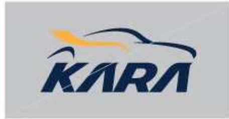
로고와 명도가 비슷한 배경 컬러 금지