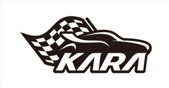
Black & White