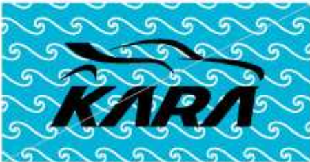
화려하거나 복잡한 패턴 금지