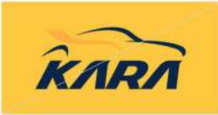
로고와 컬러감이 비슷한 배경 컬러 금지