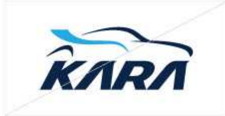
임의대로 컬러 조합 변형 금지