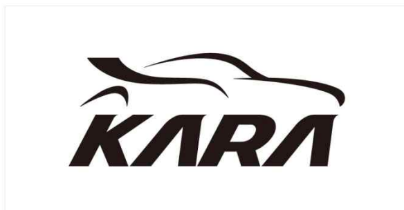
Black & White