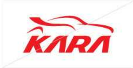
임의대로 컬러 변형 금지