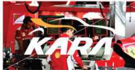
화려하거나 복잡한 사진 배경 금지